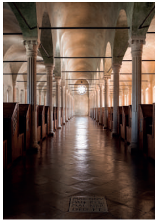
Cesena, Biblioteca Malatestiana, Aula dei Nuti.

Ideato da Alberto Casadei e curato da Gabriella Albanese, Sandro Bertelli e Paolo Pontari, il percorso espositivo su “Dante e la Divina Commedia in Emilia-Romagna” si snoda in un fil rouge che accomuna tutti gli eventi, costituito dallo studio della tradizione, della ricezione e dei contesti danteschi fino all’Umanesimo. Sono complessivamente 14 le mostre che prevedono l’esposizione di manoscritti, incunabili e cinquecentine della Commedia e di altre opere dantesche, allestite in un arco