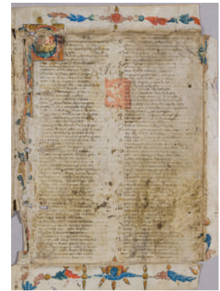
Forlì, Biblioteca Civica “Aurelio Saffi”. Frammento della Commedia .

Palatina, Parma; the Archivio di Stato, Modena; the Biblioteca Estense Universitaria, Modena; the Archivio di Stato, Bologna (where ancient notes by notaries and fragments of Dante’s poetic verses were discovered); the Biblioteca Comunale dell’Archiginnasio, Bologna; the Biblioteca Universitaria, Bologna; the Biblioteca Comunale, Imola; the Biblioteca Comunale Ariostea, Ferrara; the Centro Dantesco dei Frati Minori Conventuali, Ravenna; the Istituzione Biblioteca Classense, Ravenna; the Biblioteca Civica “Aurelio Saffi”, Forlì; the Biblioteca Malatestiana, Cesena; and the Biblioteca Civica Gambalunga, Rimini.