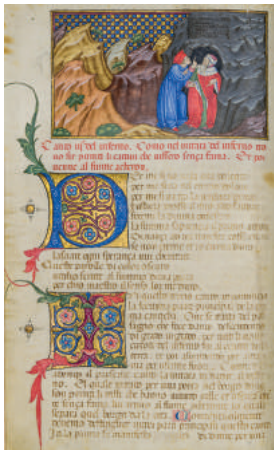
Imola, Biblioteca Comunale, ms. 76. Dante, Commedia .

Preziosi manoscritti delle opere di Dante e varie altre testimonianze storiche, documentarie, letterarie e artistiche dantesche proliferarono rapidamente a partire dal tempo e dai luoghi dell’ultimo esilio del Poeta e sopravvivono ancora oggi nelle biblioteche e negli archivi delle città lungo l’antico asse o al margine della Via Emilia, da Piacenza a Rimini, passando per Parma, Modena, Bologna, Imola, Ferrara, Ravenna, Forlì e Cesena. Per valorizzare questo rilevante patrimonio dantesco, il Servizio Patrimonio culturale della Regione Emilia-Romagna, in collaborazione con la Società Dantesca Italiana, in occasione del settimo centenario della morte di Dante (1321-2021), ha ideato un percorso espositivo diffuso, affinché ciascuna sede di conservazione diventi teatro illustrativo del patrimonio e di iniziative scientifiche e didattiche.