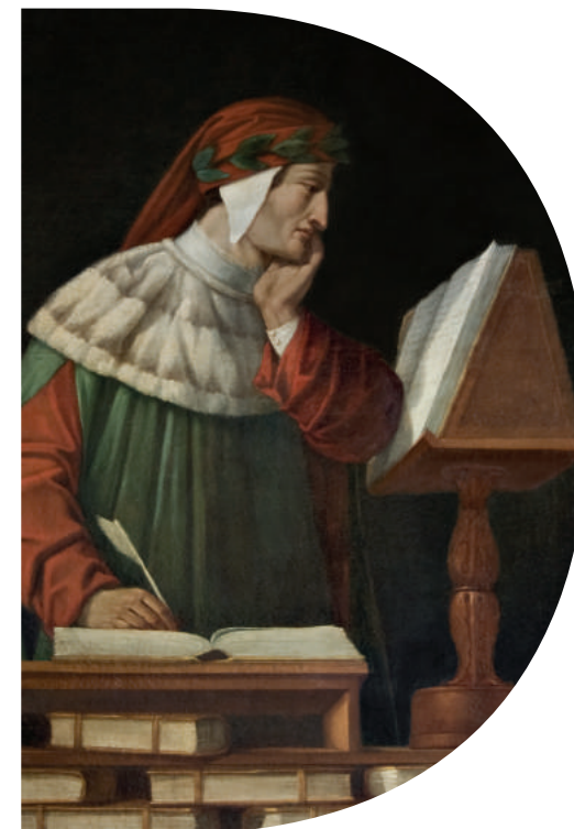
In alto: Piacenza, Biblioteca Passerini-Landi, Codice Landiano, XIV secolo (1336). Particolare dell' Inferno sul fronte: Attilio Runcaldier, Ritratto di Dante (XIX secolo), dettaglio. Ravenna, Istituzione Biblioteca Classense

VII centenario della morte di Dante Alighieri (1321-2021)