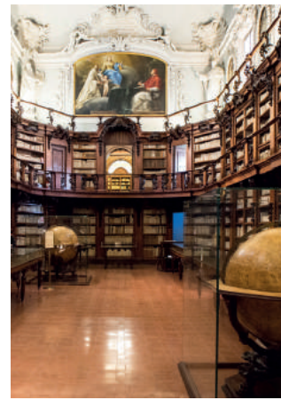
Ravenna, Biblioteca Classense, Aula Magna.

temporale che va dal Dantedi 2021 e si prolunga sino ai primi mesi del 2022. Gli istituti coinvolti sono: la Biblioteca Comunale Passerini-Landi di Piacenza (che conserva il famoso Landiano 190, codex antiquissimus della Commedia ); la Biblioteca Palatina di Parma; l’Archivio di Stato di Modena; la Biblioteca Estense Universitaria di Modena; l’Archivio di Stato di Bologna (dove sono stati scoperti frammenti e tracce notarili recanti precoci testimonianze dantesche); la Biblioteca Comunale dell’Archiginnasio di Bologna; la Biblioteca Universitaria di Bologna; la Biblioteca Comunale di Imola; la Biblioteca Comunale Ariostea di Ferrara; il Centro Dantesco dei Frati Minori Conventuali di Ravenna; l’Istituzione Biblioteca Classense di Ravenna; la Biblioteca Civica “Aurelio Saffi” di Forlì; la Biblioteca Malatestiana di Cesena; la Biblioteca Civica Gambalunga di Rimini. Un catalogo unico (pubblicato da Silvana Editoriale) accompagna il percorso espositivo, con saggi introduttivi a firma di competenti studiosi del mondo accademico e di esperti del patrimonio librario antico e con sezioni specifiche dedicate al posseduto dantesco di ogni istituto coinvolto. Il tutto corredato da schede