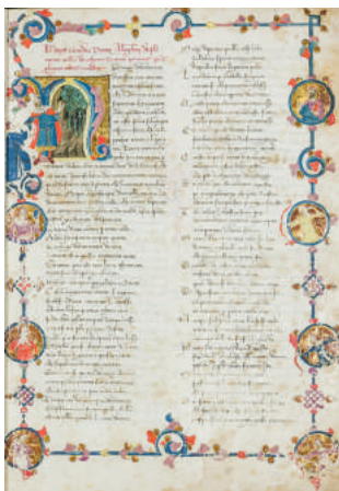
Parma, Biblioteca Palatina, ms. Parm. 3285. Dante, Commedia .