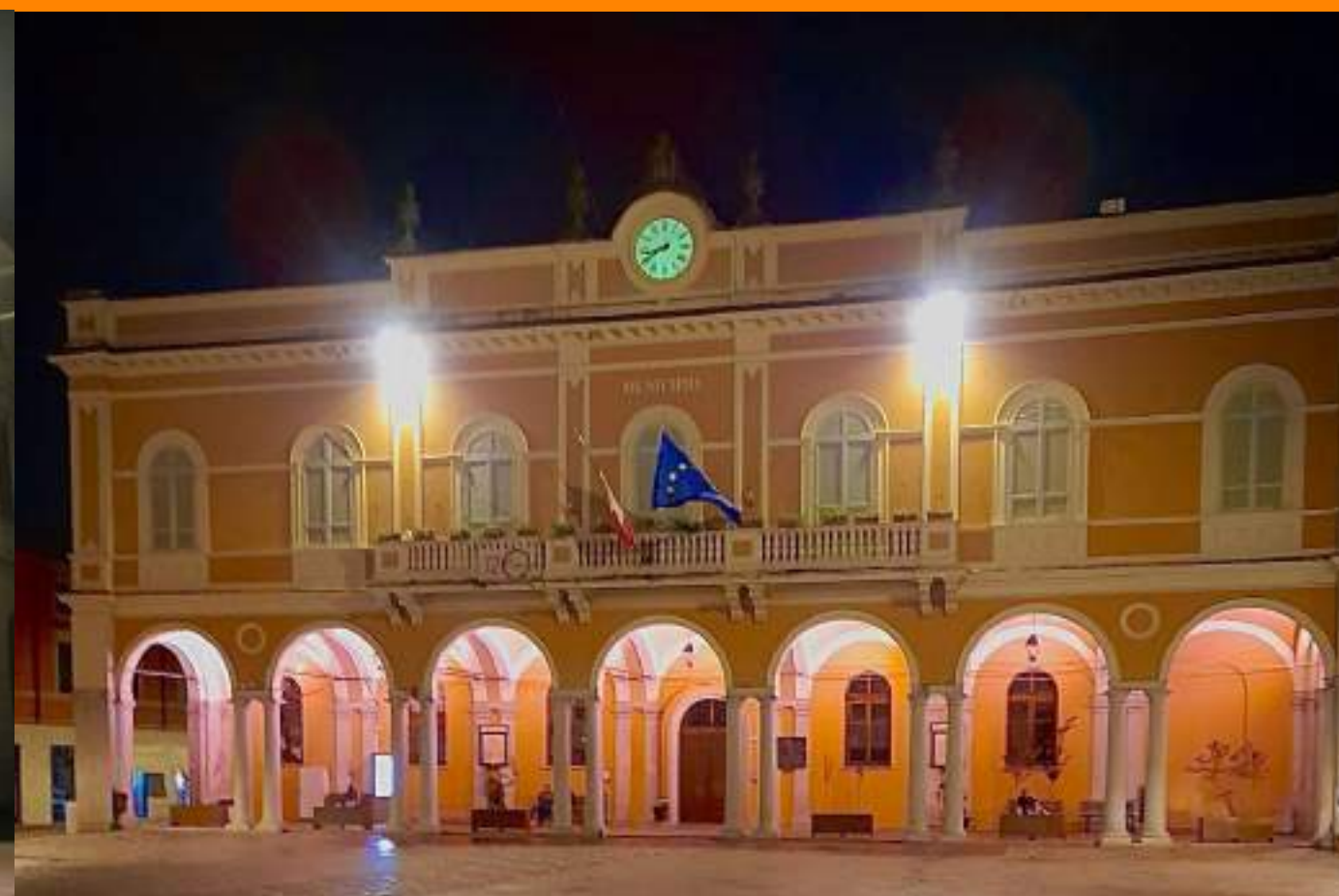
Castel San Giovanni