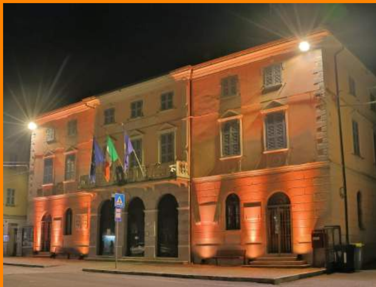
Municipio di Gropparello